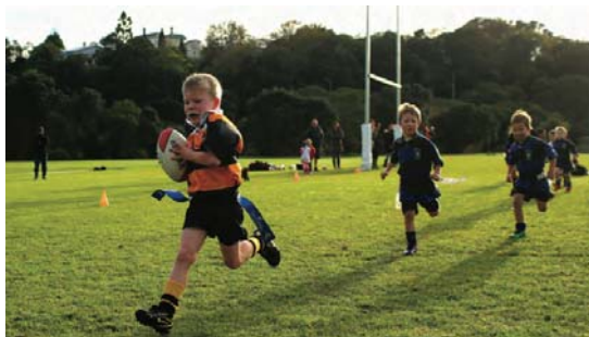
一般社団法人ラグビーパークジャパン Copyright © 2015 RugbyParkJapan All Rights Reserved.